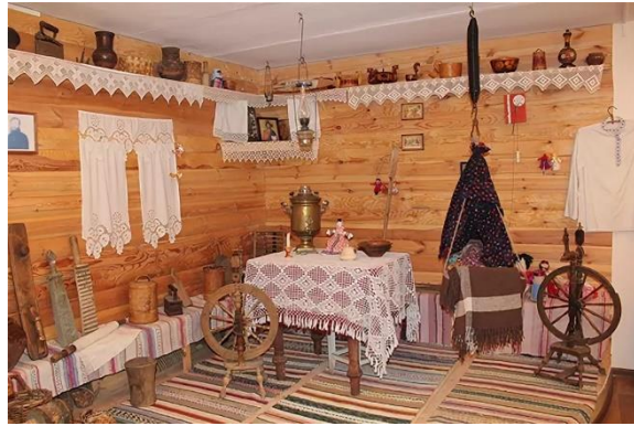
Экспозиция «Русская изба конца XIX - начала XX вв.»

QR-код экспоната позволит самостоятельно ознакомиться с описанием того или иного экспоната