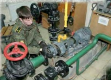
«Монтаж, эксплуатация и ремонт систем жизнеобеспечения объектов военной инфраструктуры и специальных защищенных сооружений»