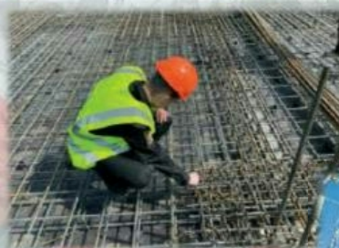
«Строительство и эксплуатация зданий и сооружений»

В настоящее время в институте трудятся более 25 докторов наук и профессоров, 135 кандидатов наук и доцентов. Основа подготовки специалистов – солидная учебная база: в институтских корпусах более 260 аудиторий, оснащенных современным оборудованием. Учебный центр института в п. Приветнинское оборудован всем необходимым для проведения производственной и учебной практики. В институте осуществляются теоретические и экспериментальные изыскания и исследования в решении комплексных вопросов жизнеобеспечения сооружений и эксплуатации объектов, а также ведется подготовка научных и научно-педагогических кадров в докторантуре, очной и целевой альюнктуре.