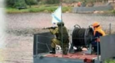
«Строительство и эксплуатация зданий и сооружений и специальных объектов военно-морских баз»