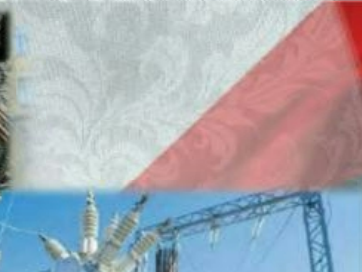
«Тепло- и электрообеспечение специальных технических систем и объектов»