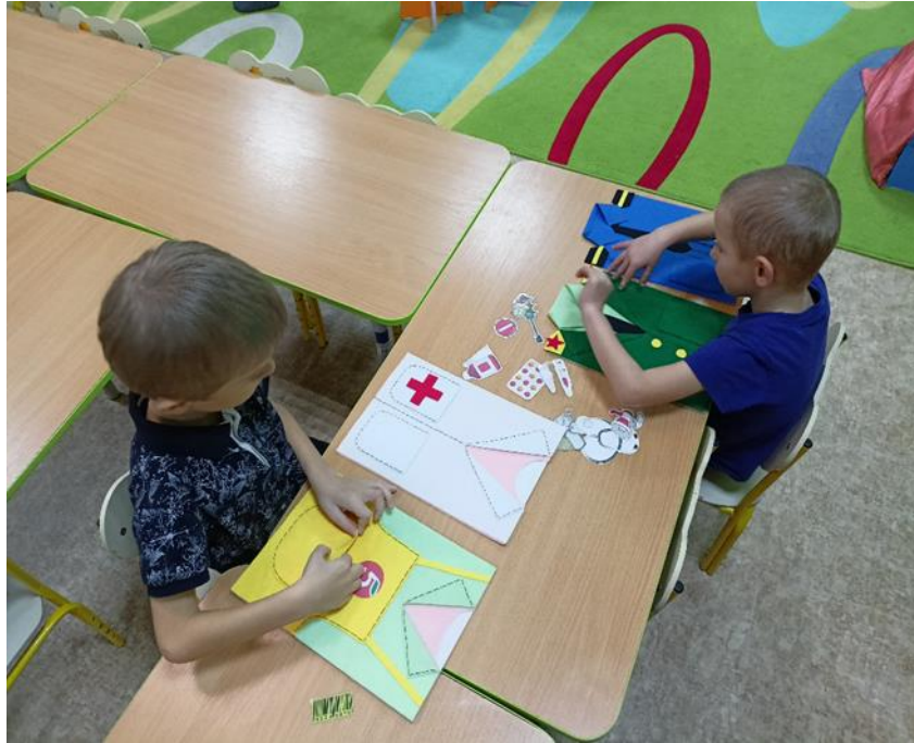
Сортер «Профессии в рубашках»